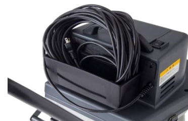
●フリーBOX (電源コード収納)