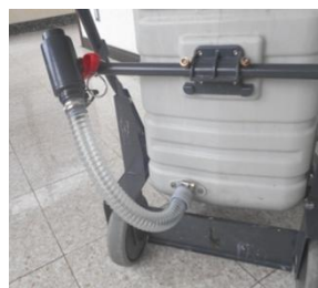
●汚水排水 ①タンクごと ②タンク後方回転 ③排水ホース※オプション