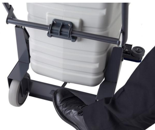
●スクイジー昇降ペダル