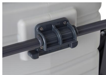
●タンク回転ブラケット