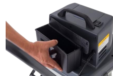
●フリーBOX＝取外し簡単