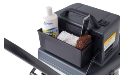
●フリーBOX (作業小物収納)