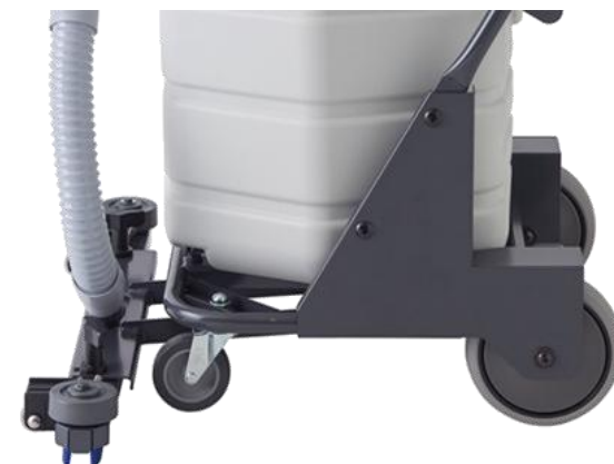
●大型カートホイール